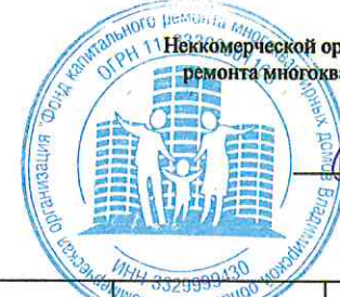
График производства работ